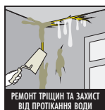
РЕМОНТ ТРІЩИН ТА ЗАХИСТ ВІД ПРОТІКАННЯ ВОДИ