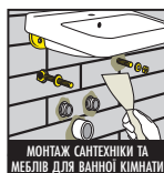
МОНТАЖ САНТЕХНІКИ ТА МЕБЛІВ ДЛЯ ВАННОЇ КІМНАТИ