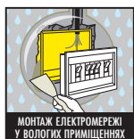
МОНТАЖ ЕЛЕКТРОМЕРЕЖІ У ВОЛОГИХ ПРИМІЩЕННЯХ