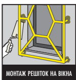
МОНТАЖ РЕШТОК НА ВІКНА