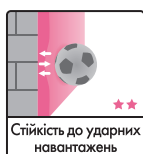
Стійкість до ударних навантажень